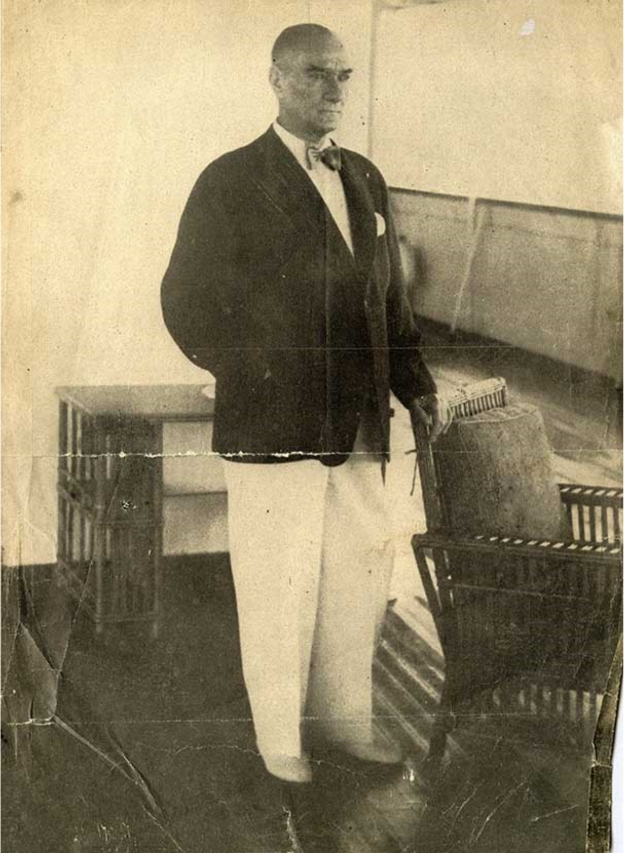
16 Kasım 1938 tarihinde Mustafa Kemal Atatürk'ün tabutu, Türk bayrağı ile örtülmüş bir katafalk üzerine konuldu ve Dolmabahçe Sarayı'ndaki büyük tören salonuna